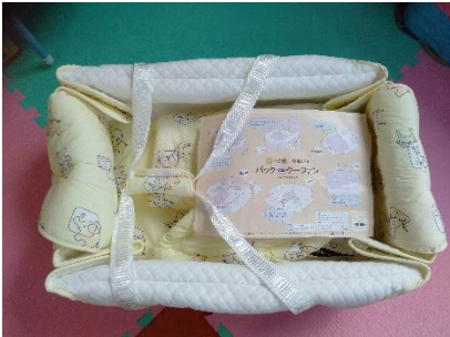
① バック de クーファン