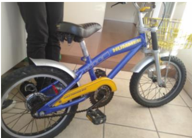
③ 自転車（青色）16インチ 3～5才男児向け(補助輪なし)