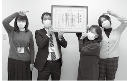
厚生労働省老健局長優良賞を受賞！