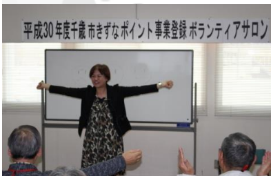
平成30年度千歳市きずなポイント事業登録 ボランティアサロン

65歳以上の方が行うボランティア活動に対してポイントを付与し、貯まったポイントを換金や寄付することができる事業です。活動を通して、社会参加と自身の介護予防につなげるお手伝いをしています。（千歳市介護予防センター） 登録者数R2.4.1：235名