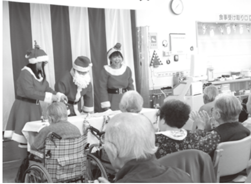
12月年末お楽しみ会 職員によるハンドベル演奏やマジックショー を楽しむ皆さん。