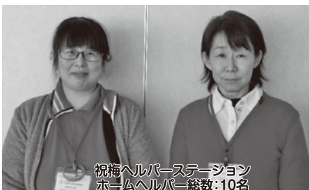
祝梅ヘルパーステーション ホームヘルパー総数:10名

自宅訪問型の福祉サービスを担う新富・祝梅ヘルパーステーションの職員です。皆様の自宅での生活を適切に支援できるよう職員一同頑張っております。