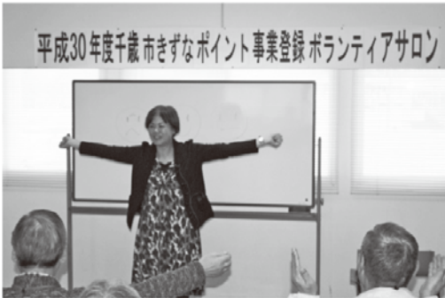
(ミニ講座「笑顔で暮らすコツ」)

千歳市ボランティアセンターには、現在、567名の方々が個人ボランティアとして登録しており、介護予防教室運営のお手伝いや施設での囲碁や将棋などの趣味活動、お話し相手など様々な場面で活動されています。普段、顔を合わせることの少ないボランティア同士の交流の機会として、千歳市ボランティアセンターとして、千歳市ボランティアや千歳市きずなポイント事業登録ボランティアアサロンを開催しています。ランチデーでは、就労継続支援B型事業所「晴レルモキッチン」のおむすびと豚汁のセット、「オーブシカフエゆみな」のパンのランチと琴やサックス、講