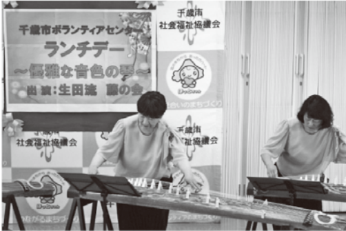
(第1回千歳市ボランティアセンターランチデー)