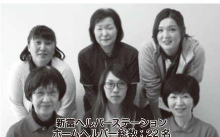
新富ヘルパーステーション ホームヘルパー総数:22名