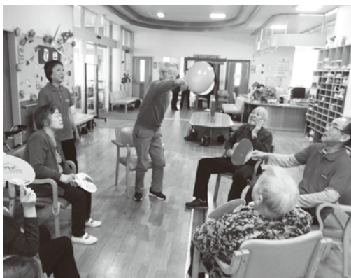
1月のお正月遊び いろはかるた取りや、風船羽子板に興じて、 にこやかな笑顔があふれていました。