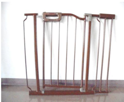
④ ベビーゲート 2点 幅 72cm～95cm対応