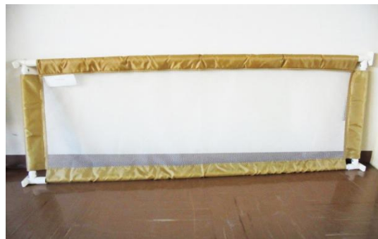
⑤ ベビーゲート H55W135