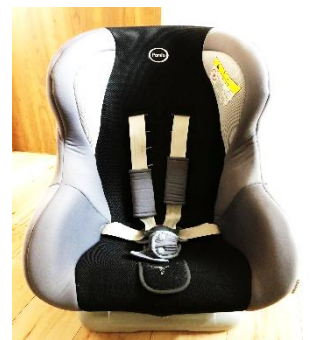
⑥ チャイルドシート