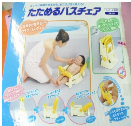
② たためるバスチェア(3か月～2歳)