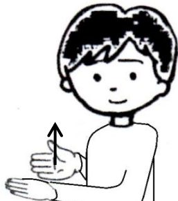
ありがとうございます