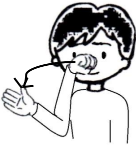
よろしくお願いします