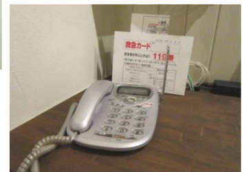
電話付近への設置→