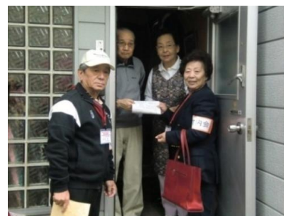
写真：町内会による配付の様子

一度に全世帯への配付は負担が大きいため、救急カードの必要性の高い高齢者世帯や障がい者世帯から優先的に配付をし、段階的に全世帯への配付を進めています。